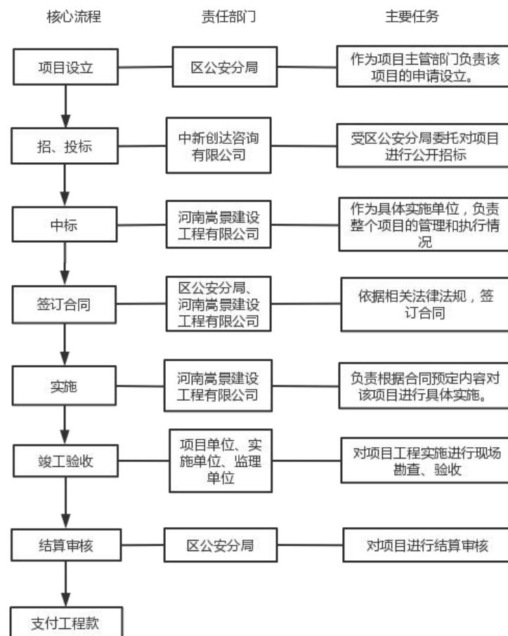
图 1-2: 项目管理流程图

局作为主管部门申请设立“濮阳市公安局工业园区分局大数据中心装修工程”项目。2021年5月12日，区公安分局委托中新创达咨询有限公司对该项目进行公开招投标，5月24日经评标委员会评审，确定由河南嵩景建设工程有限公司中标，并将中标结果进行公示。双方签订合同后，河南嵩景建设工程有限公司按照合同约定对该项目进行具体实施。工程竣工后组织相关人员进行验收，验收合格后报送审计处进行审计结算。具体流程如下图：