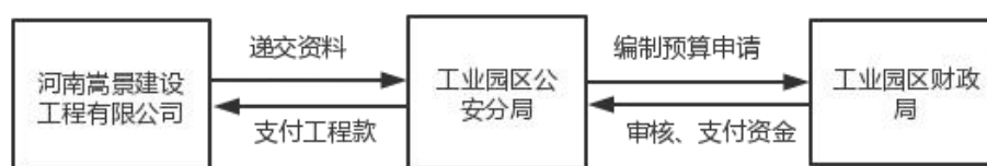
图 1-1: 资金拨付流程图

根据项目单位提供的资料,项目单位是工业园区公安分局,具体施工单位是河南嵩景建筑工程有限公司。由施工单位向区公安分局提出申请,填写“工程建设及资金拨付申请表”,经监理审查同意后,上报区财政局。经区财政批复后,将资金下达至区公安分局。由区公安分局支付至施工单位。